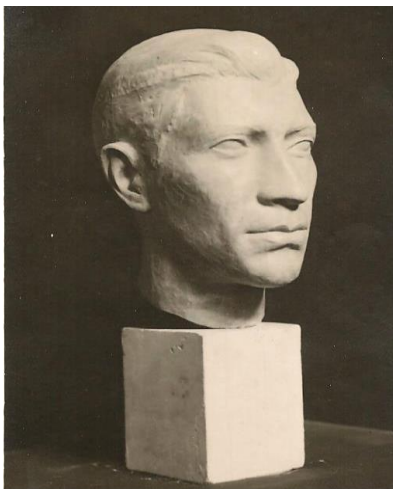
Buste représentant Max, réalisé par son camarade sculpteur L.